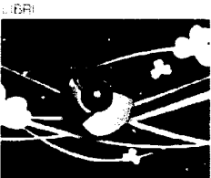
LIBRI L'editore automatico Una curiosa scoperta su Nazione Indiana