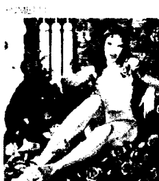
Le stanze del desiderio I fumetti di Mio Manara a Sena fino all'8 gennaio