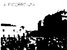
LA RICCIONESE Buon compleanno Italia Un sito per godersi i preparativi della festa del nostro Paese