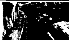
Nel Cern di Ginevra Il sito del Centro europeo di ricerche nucleari